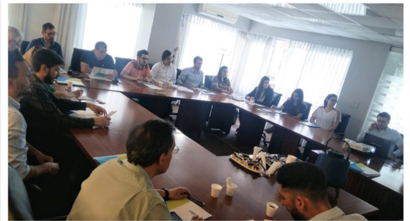
6 de diciembre Seminario Tratamientos Superficiales en CABA