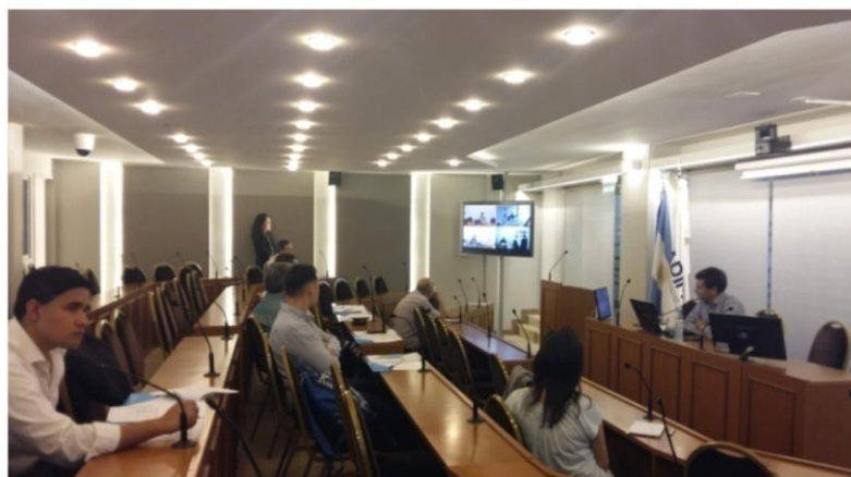
15 de noviembre Seminario de Tratamientos Superficiales en CABA