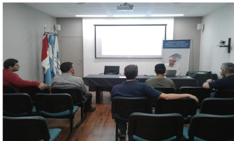
27 de noviembre Seminario de Tratamientos Superficiales en Rosario