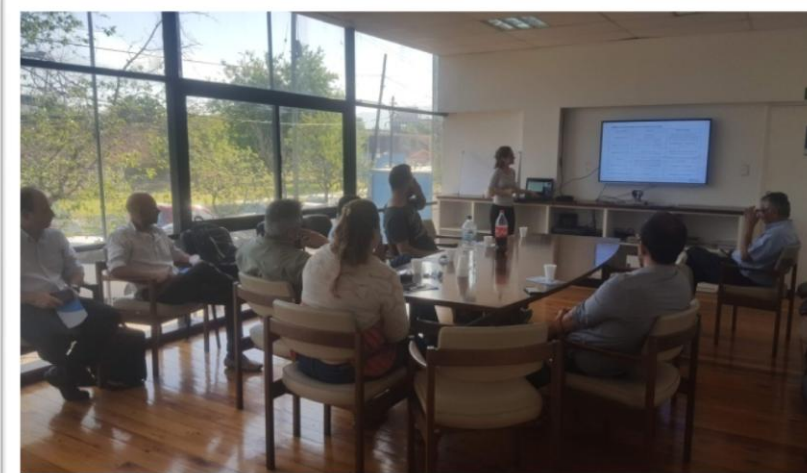
20 de noviembre Seminario Metalmecánica en Mendoza