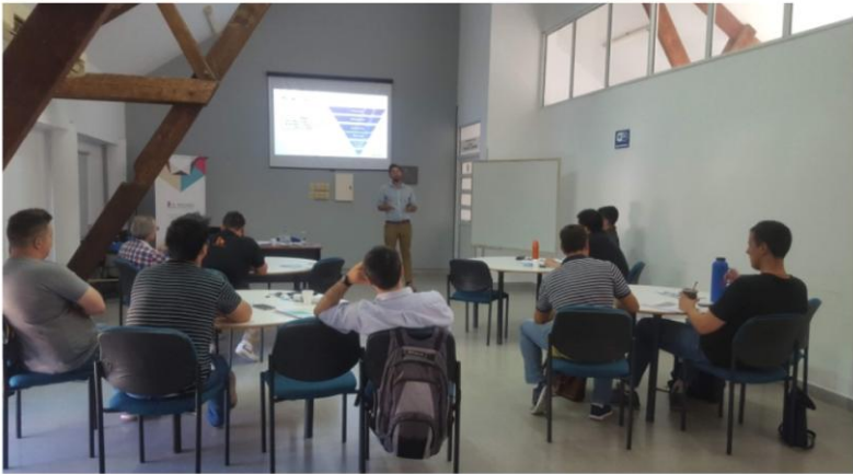
8 de noviembre Seminario Metalmecánica en Esperanza

Compartimos imágenes de las actividades de capacitaciones ya desarrolladas sobre las Guías de Producción Sustentable de los sectores Metalmecánica y Tratamientos Superficiales.